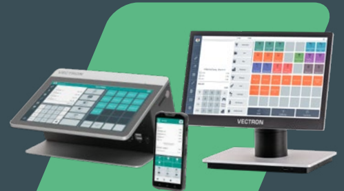
POS Life | POS M4 Pay | POS 7

Servicekräfte können Bestellungen direkt in der (mobilen) Kasse oder im Zahlungsterminal mit Kassens-App eingeben. Vectron bietet für jede Art von Filiale das passende Kassensystem.